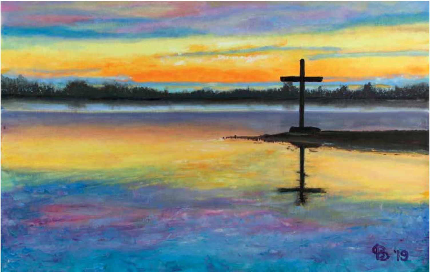
Paasbaken, olieverf op doek door Warner Bruins (2019).