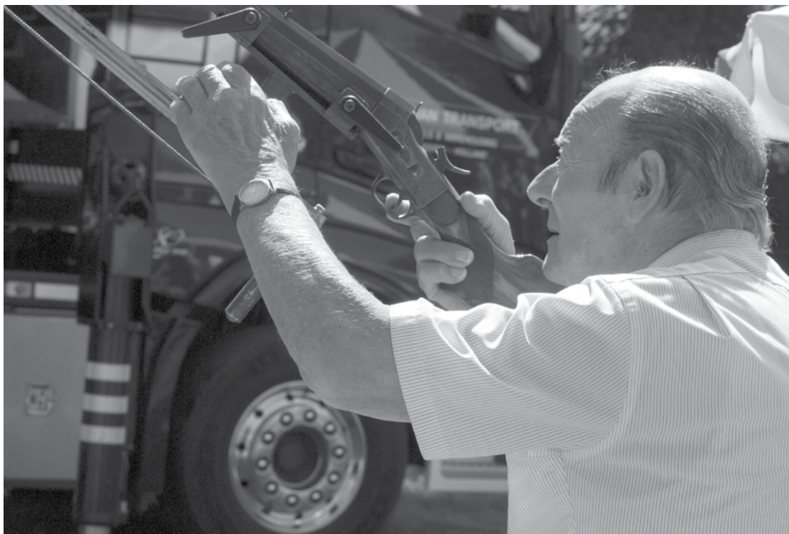
Tal van bekende Ugchelenaren legden aan. Een timmermansoog komt daar goed van pas.