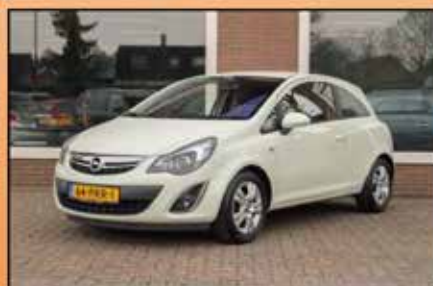
Opel Corsa 1.3 CDTI Cosmo 03-2011, 156.189km Euro5 motor = toegang tot alle milieuzones! Zuinig, voordelig en compleet. O.a. navigatie. € 4.750,-