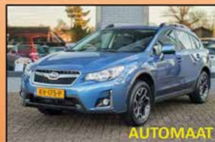
Subaru XV 2.0 Premium 12-2016, 27.194km Uitstekende caravantrekker, vierwielaandrijving. Veel comfort en luxe. Afneembare trekhaak € 28.250,-

Uw mobiliteit goed geregeld. Afgestemd op uw wensen en voorkeuren. Dat betekent voor ons uw partner in mobiliteit . Wij houden u 24/7 mobiel. Niet iedere week of maand een auto nodig? Bespaar dan, en huur een auto, bedrijfsbus of verhuiswagen. Snel, eenvoudig en goed geregeld.