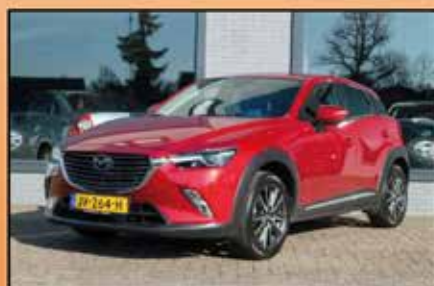
Mazda CX-3 2.0 GT-M 06-2016, 46.270km Complete uitvoering. Navigatie, stoelverwarming, LED koplampen, afneembare trekhaak € 23.250,-