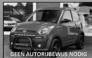
Microcar M.GO Highland X Robuuste en stoere brommobiel, met bullbar € 14.995,- € 250,- per maand, incl verzekering