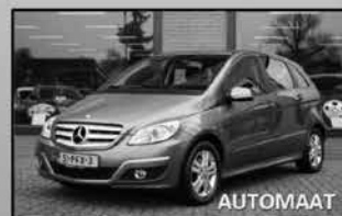
Mercedes-Benz B-klasse 01-2011, 50.858km Cruise control, trekhaak, camera € 14.850,-