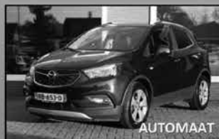
Opel Mokka X 1.4 Turbo 04-2017, 16.442km Navi, parkeercamera + sensoren € 26.350,-