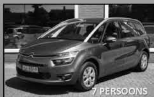
Citroën C4 Gr. Picasso 06-2015, 98.909km Navi, trekhaak, cruise control € 18.375,-