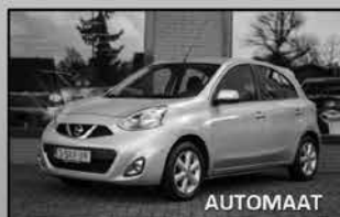
Nissan Micra 1.2 DIG-S 10-2013, 50.864km Parkeersensoren, navi, cruise € 10.450,-