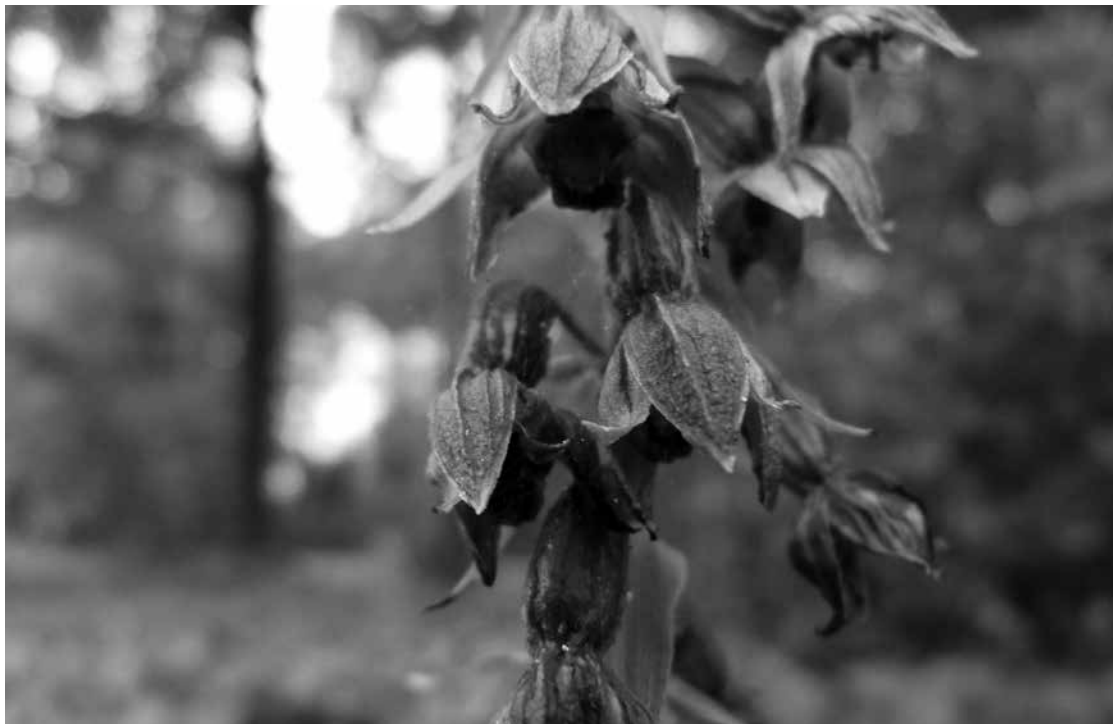
Zo ziet de Brede Wespenorchis er in zijn eerste levensfase uit. Een maand, zes weken later, sieren prachtige bloempjes deze inlandse orchidee.

Orchideeën staan bekend als dure bloemen, die je soms in de bloemenwinkel koopt. Men denkt dan vaak aan tropische planten. Maar ook in Nederland, zelfs bij ons in de buurt, komen inlandse orchideeën voor!