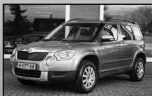
Skoda Yeti 1.2 TSI 04-2010, 165.844km Airco, licht metaal, trekhaak € 7.450,-