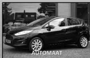
Ford Fiesta 1.0 Titanium 02-2016, 28.880km Parkeersensoren, navi, cruise € 12.950,-