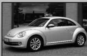
Volkswagen Beetle 1.2 07-2012, 78.393km Navi, parkeersensoren, cruise € 9.950,-