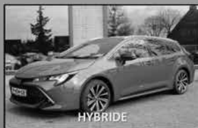
Toyota Corolla 1.8 Hybrid 03-2022, 20.685km Stoelverwarming, parkeercamera € 27.100,-