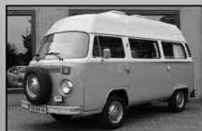
VW T2 Kampeerbus 2.0 06-1975, 245.834km Goed onderhouden, goede staat € 22.950,-