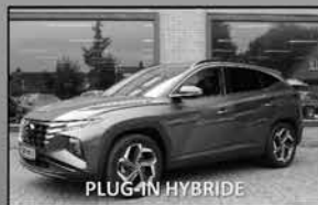
Hyundai Tucson 1.6 T-GDI 04-2021, 35.780km Stoelverw., Carplay/AndroidAuto € 34.500,-