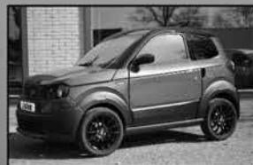
Ligier Myli Electric Citycar Volledig elektrisch Apple carplay/AndroidAuto, airco, parkeercamera v.a. € 12.160,-

Uw partner in mobiliteit Keuze uit ruim 60 occasions!