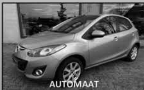
Mazda 2 1.5 GT-L 03-2013, 69.660km Climate control, stoelverwarming € 11.750,-

Uw partner in mobiliteit Keuze uit ruim 60 occasions!