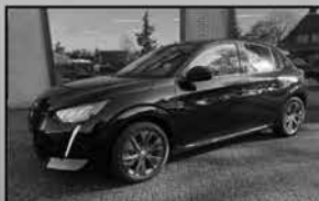
Peugeot e-208 Allure Pack 06-2021, 35.868km Camera, virtual cockpit, cruise € 18.900,-