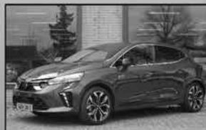
Mitsubishi Colt Intense+ HEV 01-2025, 15km Navi, stoelverw., park. camera € 28.250,-