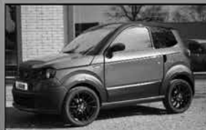
Ligier Myli Electric Citycar Volledig elektrisch Apple carplay/AndroidAuto, airco, parkeercamera v.a. € 12.160,-