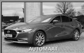
Mazda 3 e-2.0 Luxury 01-2023, 27.920km Leer, trekhaak, stoel/stuur verw. € 32.950,-