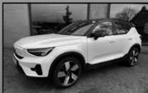
Volvo XC40 Recharge 01-2023, 34.506km Twin Engine, open dak, LED € 42.900,-