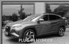
Hyundai Tucson 1.6 PHEV 02-2022, 31.569km Hoge zit, stoelverwarming, camera € 32.750,-