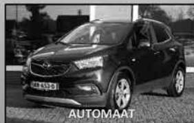
Opel Mokka X 1.4 Innov. 04-2017, 157.831km Cruise, navi, climate, park. sens. € 14.750,-