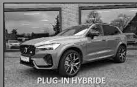
Volvo XC60 T8 Polestar 05-2022, 116.785km Leer, trekhaak, groot open dak € 53.950,-