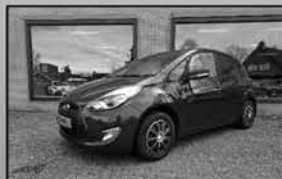
Hyundai IX20 1.6 Go! 10-2015, 140.670km Trekhaak, camera, 1 e eigenaar € 9.950,-