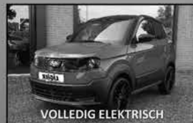
Ligier Myli 12kWh R.ebel Citycar 11-2023, 10.102km Rijden zonder autorijbewijs, veilig en droog. Airco en stuurbevestiging € 18.500,-

Uw auto- en brommobiel- dealer voor Apeldoorn en de Veluwe