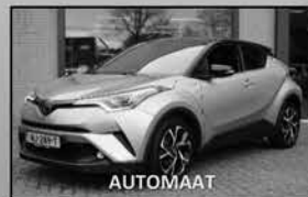
Toyota C-HR 1.8 Bi-Tone 02-2017, 89.299km Open dak, stoel+stuurverwarming € 18.875,-