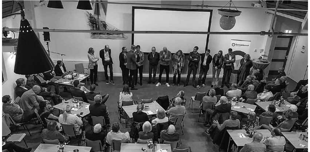
Aan het eind van de avond vertelden de raadsleden wat hun het meest was opgevallen.